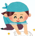
夏と冬には大掃除