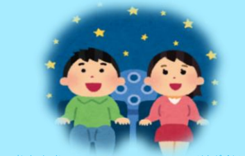
大人向けプラネタリウム見学会