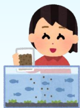
メダカや金魚飼育