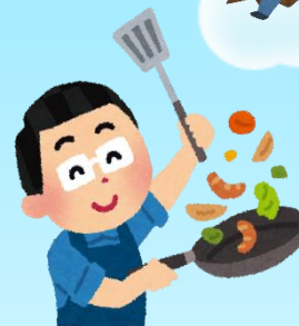
りょうりょく お料理と食事会