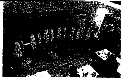
コーラスのスコラカントルム IRMA の皆様

約1年前から始まった新規B型事業所立ち上げ構想、すんなり進まない会議（すいません、愚痴です。）、メンバーさんにしろ、職員にしろそれぞれの価値観が違うものですから、希望や要望の擦り合わせをして会議にのぞむのですが、ひっくり返されたりして。もう思い出すのが嫌なくらいです。