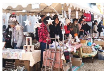
センターまつりでの様子 ←

また子供向けの数字合わせのくじでは私も一緒にあって応援したりして当たりが出たときはおめでとう！って言ってあげたり、ハズレの場合はまたチャレンジしてくれるよう笑顔でまた来てね！と接客したらまたチャレンジしに来てくれたので接客や販売に欠かせないのは笑顔なんだなあとすごく実感しました。次につなげたいです！そしてすっごく楽しかったです！！